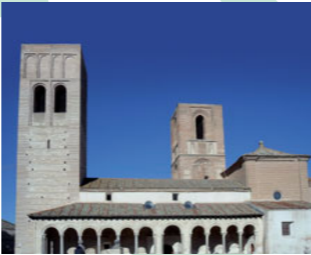
Iglesia de S. Martín

Esta bonita iglesia está dominada por sus torres, denominadas gemelas, pero que en realidad son diferentes en cuanto a aspecto y cronología. La de “los ajedreces” es la más antigua y aparece decorada en su parte superior, entre otros motivos, por tableros en ladrillo de este juego. La “nueva” (datada en torno al año 1200) presenta un desarrollo liso sólo interrumpido por el cuerpo de campanas y el friso superior a éste de arcadas de medio punto.