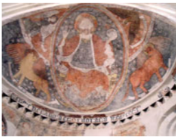
Pintura de Santa María la Mayor

El cierre de este conjunto, opuesto a la Iglesia de San Martín , lo conforma la Iglesia de Santa María con una prototípica cabecera románico-mudéjar decorada con arcadas de medio punto de ladrillo y su torre-campanario con arco de paso en su base, bajo el cual discurre la Calle Santa María . La campana de esta torre era la que realizaba los 100 toques que indicaban el cierre de las puertas de la muralla cuando llegaba la noche.