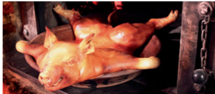
Cochinillo o tostón asado

En cuanto a la repostería, la más tradicional es aquella que recuerda más a nuestro pasado árabe, como las Tortas de Veedor o los Rozneques, sin olvidar pasteles o mantecadas.