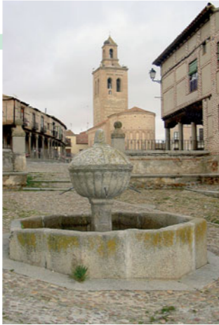
Plaza de la Villa

La judería se extendía hasta las inmediaciones de este templo cristiano. Como en el resto de las iglesias de Arévalo , su fundación se fecha en el S. XII, aunque en la actualidad de esos momentos tan sólo restaría la torre y la capilla románica situada bajo ella. El resto de la edificación es del S. XVI. Su interior se encuentra dividido en tres naves por grandes arcadas sustentadas sobre columnas de piedra y sus cubiertas son bóvedas y una cúpula barrocas.